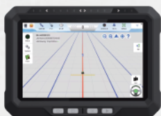
タブレットディスプレイ